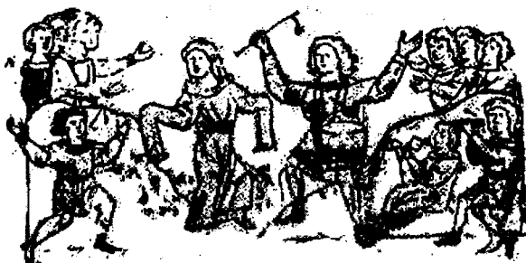
Миниатюра Радзивилловской летописи

Тут же мы начинали вспоминать о Карпатских горах. В то время наш род именовался — карпени. Те, которые стали жить в лесах, именовались по названию — дrevичи, а на полях мы назывались полянами.