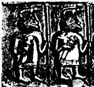
Германо-скандинавские воины. VIII в.