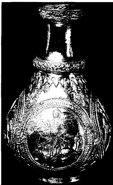
«Обри примучиша дулебы». Аварский сосуд

3 И должны мы были пойти на греков, и не могло быть иначе. И так решили на вече с вождями своими — идти до Дуная и далее 2 . И оттуда мы повернули и стали тотчас