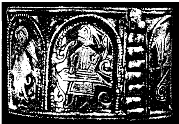
Боян на браслете из Киева. XII в.

Волхи пришли и голядь, корень от Руса их происходит. Так же как руки плечам нужны — князю нужны те мужи.