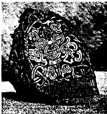
Рунный камень Гарольда Синезубого (986 г.) с древнейшим в Северной Европе ликом Распятого Спасителя (Христа и Буса)

3 И мы не позволили Жале никуда течь. И после зимы настало лето, и после печали — радость. И Дед наш Дажьбог привечал воинов — многих наших отцов, которые одерживали победы. И не было бед и забот многих, и так земля готская стала нашей. И так до конца пребудет.