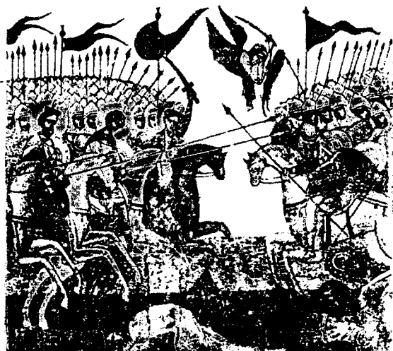
Русичей ведёт в бой Матерь Слава. Новгородская икона XIV в.

И бросается на врагов, бьёт крыльями Матерь Сва и кличет нам, чтобы мы шли за землю нашу и бились за очаги нашего племени, ибо мы — русичи.