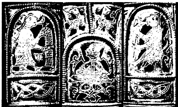
Браслет из старой Рязани. XIII в. н. э. Справа Бус в образе Дажьбога, слева его супруга в образе Живы, в центре Боян

Побуде. И так же Время Бусово весьма прослав- ляли 1 .